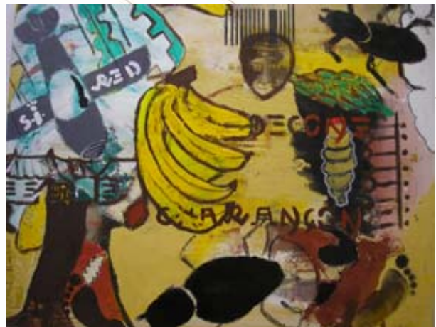
Cloudecone , 2007