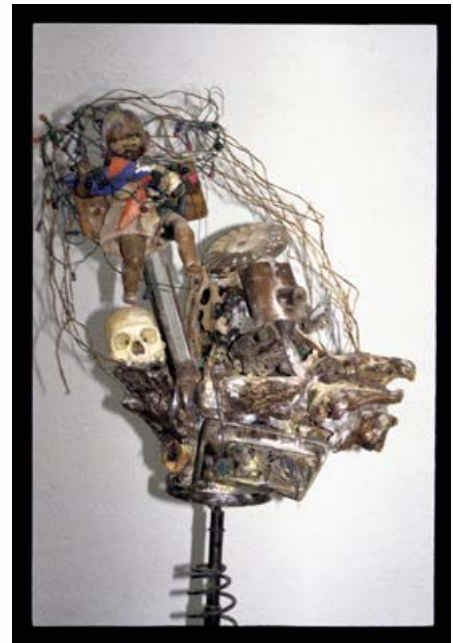
Poupée , 2002