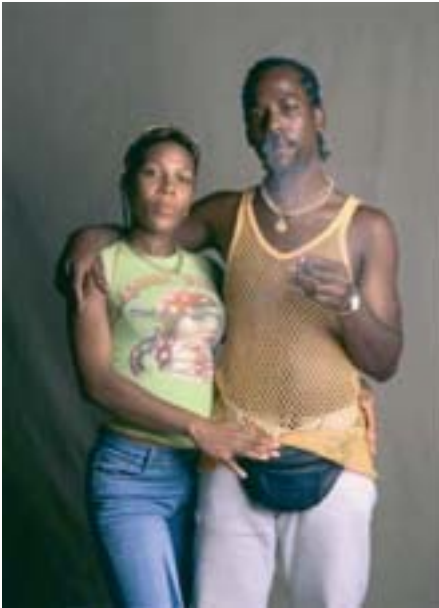
Sans titre, 1998 Série Texaco