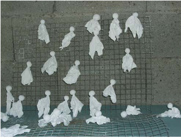
Les Ombres de la nuit éternelle

Poupées de coton sur fer grillagé. Année 2006