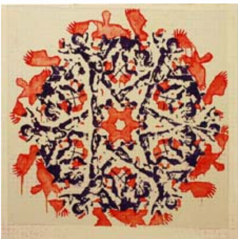
Jamaican Icarus , 2005, oil/paper/canvas, 36" x 36" © Charles Campbell

Né en 1970 en Jamaïque, Charles Campbell émigre avec sa famille au Canada en 1975. En 1993, il retourne en Jamaïque et s'installe à Kingston. En 1997, il participe à une résidence d'artistes au Royaume-Uni où il reste pour passer un diplôme à l'université de Londres qu'il obtient en 1998. En 2002, il retourne au Canada où il est actuellement coordinateur pour la galerie Xchanges .