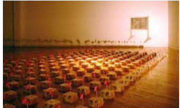
Attack of the Sandwichmen, A space Gallery, 2004, Toronto ©small axes

une centaine de sandwiches au pain blanc coiffés d'un drapeau de Trinidad et Tobago, évoque l'exode vers les sociétés majoritairement blanches du nord. Cette œuvre interroge le concept de créolisation et soulève des questions sur le déracinement, les diasporas, l'appartenance et le multiculturalisme et cela influe sur les interventions artistiques.