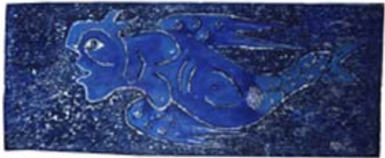
Sirène Bleue