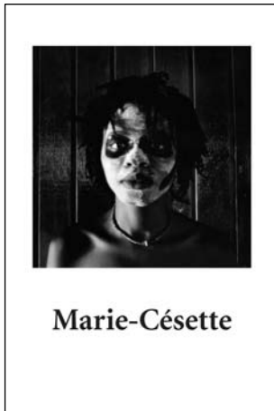
Affiches , 2005

Depuis 1999, date de son premier voyage à Haïti à l'âge de 20 ans, Guillaume Coadou a séjourné à plusieurs reprises et pour de longs mois dans ce pays où il a réalisé plusieurs séries de photographies et des vidéos. "Guillaume Coadou a immergé son isolement d'artiste dans les milieux populaires, riches de vie, souffrants, parfois violents, souvent eux-mêmes enfermés, de Port-au-Prince. Le travail qu'il en a retiré est remarquable : au plan artistique, incontestablement. Mais c'est aussi un travail tout rempli du respect des hommes, des choses et du monde, qui se situe bien au-delà d'un simple exercice professionnel." (Alain Sancerni).