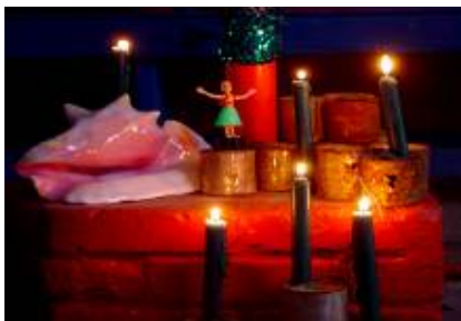
Détail de l'installation de Fred Koenig, Forum 2004 Institut Haitiano-Américain – Port-au-Prince

Le moment lui-même, par son caractère de transition politique, porteur une fois de plus, d'espoir, voire de solidarités internationales, la paix et la sécurité (merci aux 9.000 casques bleus), s'installant lentement et peut-être sûrement, multiplie les pistes, décuple les angles d'analyses... Haïti, au-delà du débat des cultures, un terroir faits de singularités.