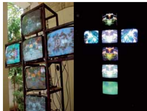
Installation Vidéo « Kwa Bawon » de Maxence Denis

2006 - Le thème : « Corps exploités » permettra à des chercheurs et à des créateurs, d'aborder des problèmes d'actualité tels que l'esclavage moderne, les rapports de domesticité, le trafic d'enfants, d'organes, la science, la prostitution, la pornographie, la mode, la publicité, les sexualités, le VIH, mais aussi des formes plus antiques d'exploitation du corps, la traite, la torture, l'incarcération, les guerres, les jeux, les rituels, les rites funéraires, le mariage, la religion, la transe, la danse, le tatouage, les scarifications, les mortification, les mutilations, les initiations, le théâtre, le portrait, la représentation humaine... Le choix du nouveau thème fait écho à celui du 3ème Forum « Codes Noirs » qui introduisait entre autres, une réflexion sur la traite négrière dans le Nouveau Monde.