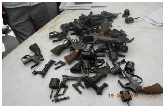
Sculptures pour la Paix. MUPANAH. Juin 2006. En collaboration avec le DDR et la MINUSTAH.