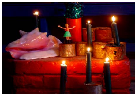
Détail de l'installation de Fred Koenig, Forum 2004 Institut Haitiano-Américain – Port-au-Prince

2000 : Le premier Forum, avec pour thème « Identité et diversités au seuil du XXI e siècle » a été inauguré dans un contexte de violence électorale, le 3 avril 2000 marqué par l'assassinat du journaliste mondialement connu : Jean Dominique . Il s'est déroulé à Port-au-Prince, et rassemblait des créateurs et des conférenciers du Sénégal, du Mexique, de l'Équateur, de Porto Rico, de la République Dominicaine, du Canada et d'Haïti.